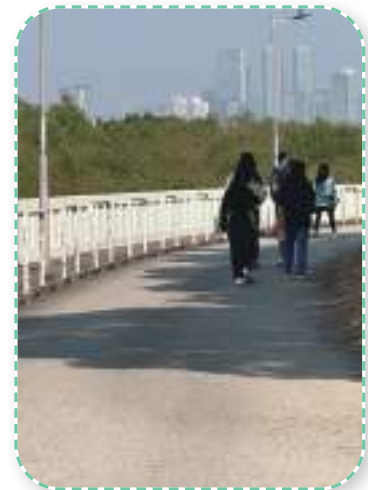
元朗南生圍風景如畫，綠意盎然，那裏的濕地也是候鳥天堂。家長與學生們一邊沿着河邊散步，一邊觀賞鳥兒，十分寫意！