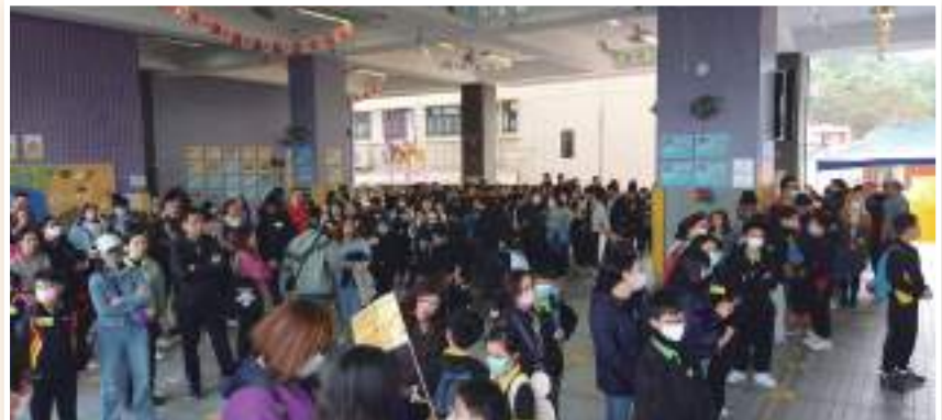
早上，各位家長與學生先在學校集合，大家也「未出發，先興奮」，場面十分熱鬧。