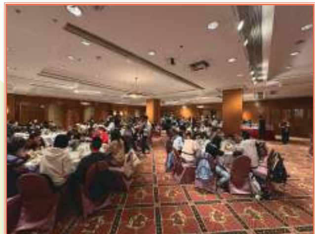
中午，大家到天水圍嘉湖海逸酒店享用豐富的自助午餐。